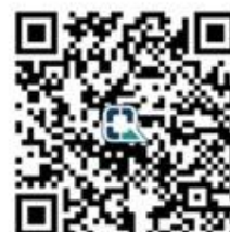
ชำระเงิน

2. นักเรียนนักศึกษานำหลักฐานการชำระเงิน พร้อมใบลงทะเบียนส่งฝ่ายพัฒนาเพื่อขึ้นทะเบียนในการช่อมกิจกรรม