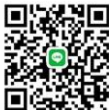
ส่งหลักฐาน

และแจ้งรหัสนักเรียน ชื่อ-นามสกุล พร้อมแนบสลิปการโอนเงิน (ภายในวันที่โอน)