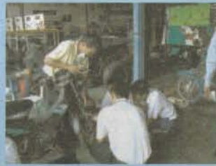
แผนกวางแผน & เทคนิคพื้นฐาน การตรวจซ่อมจักรยานยนต์เบื้องต้น