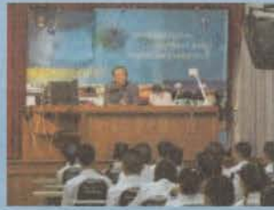
พิธีเปิด