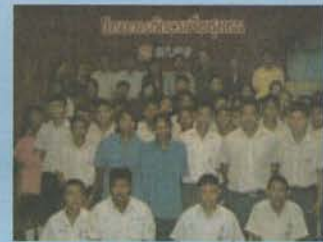
พิธีปิด & ถวายพรบกัน

ในวันที่ 25 กุมภาพันธ์ 2549 โรงเรียนอักษรเทคโนโลยีวิทยาได้จัดกิจกรรมบริการชุมชน เพื่อสานสัมพันธ์ที่ดีระหว่างโรงเรียนกับชุมชนด้วยหลักสูตรระยะสั้น โดยมีวัตถุประสงค์เพื่อให้นักเรียนที่เข้ารับการอบรมได้มีทักษะพื้นฐานทางวิชาชีพ และเป็นแนวทางในการศึกษาต่อ