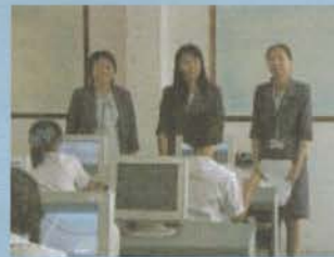
แผนกบัญชี Accounting and Microsoft Excel used in Accounting