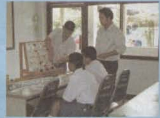
แผนกช่างไฟฟ้ากำลัง & อิเล็กทรอนิกส์ ติดตั้งไฟฟ้าในบ้านเบื้องต้น