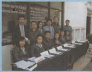
ลงทะเบียน