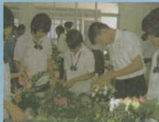
แผนกการชายและการตลาด การจัดดอกไม้สด