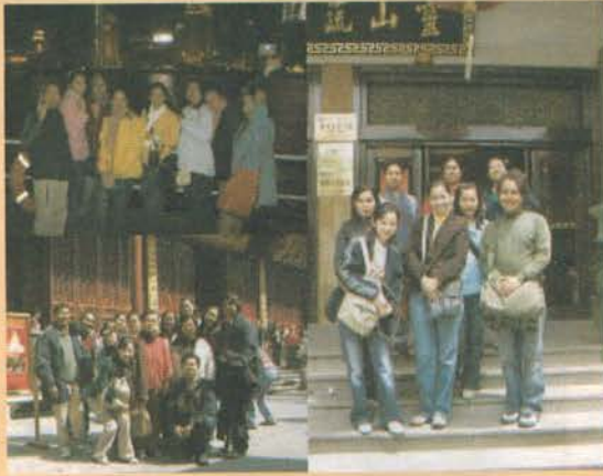
คณะครู/อาจารย์โรงเรียนในเครืออักษรรูป ทัศนศึกษา นอกสถานที่ นครเซี่ยงไฮ้ ประเทศสาธารณรัฐประชาชนจีน ระหว่างวันที่ 16 - 21 เมษายน 2549