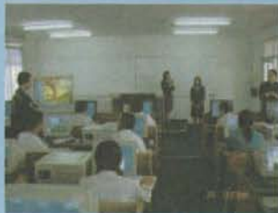
แผนกคอมพิวเตอร์ การตกแต่งภาพด้วยโปรแกรม Adobe Photoshop