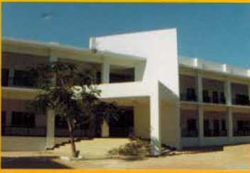
โรงเรียนอักษรเทพประสิทธิ์

เปิดสอนระดับอนุบาล 1 - มัธยมศึกษาปีที่ 3 ถนนเทพประสิทธิ์ โทร. 0-3841-2118