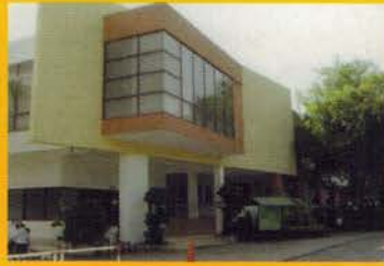
โรงเรียนอักษรพัทธนา

เปิดสอนระดับอนุบาล 1 - มัธยมศึกษาปีที่ 3 ถนนเทพประสิทธิ์ โทร. 0-3841-2118