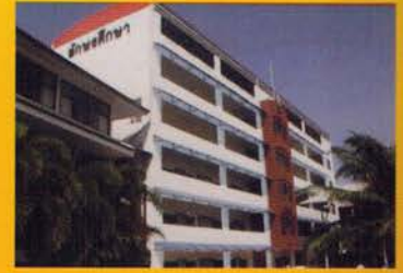
โรงเรียนอักษรดีกษา

เปิดสอนระดับอนุบาล 1 - มัธยมศึกษาปีที่ 3 พัทธนาใต้ โทร. 0-3837-4532-3