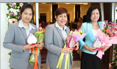
รางวัล ครุติในดวงใจ ประจำปี 2557