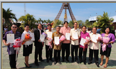
รางวัล 1 แสหนครุติ ประจำปี 2556

สถาบันอาชีวเอกชน แห่งแรกของชลบุรี ที่ผ่านการรับรองมาตรฐานการศึกษา รับรองจาก สมศ. ด้านอาชีวศึกษา